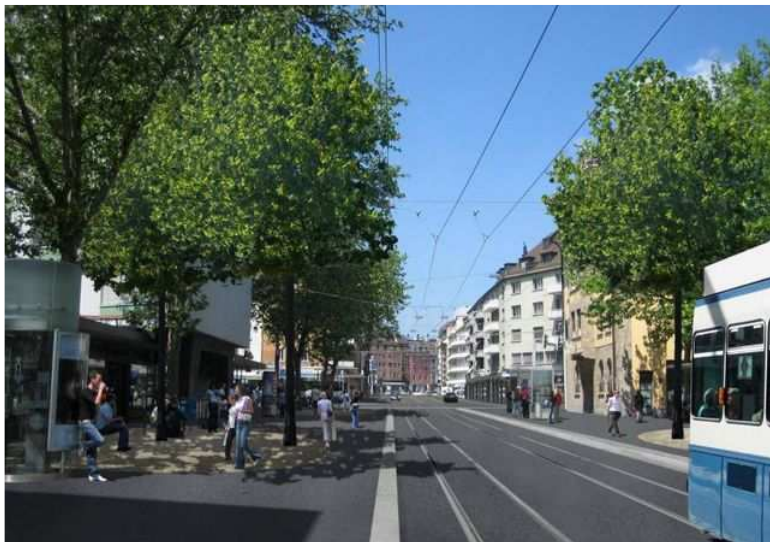
Schmiede Wiedikon: Wo heute eine Strasse an der Tramhaltestelle vorbeiführt (l.), soll ein Begegnungsraum entstehen (r.).

Die bürgerlichen Gemeinderäte haben gestern das Referendum gegen die Neugestaltung ergriffen.